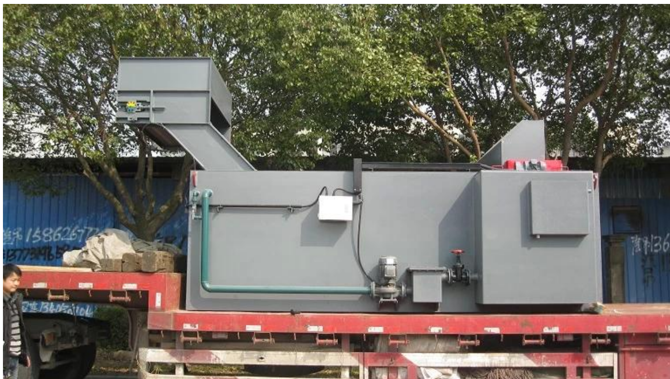
El enfriamiento del tanque de aceite: