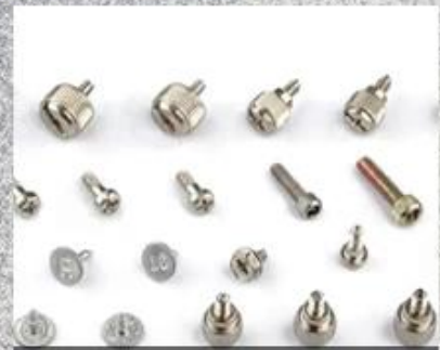
Flange Head Screw