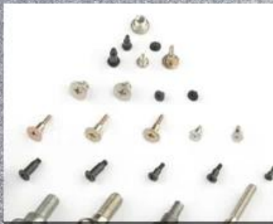
Multi-stage Special Shaped Screw