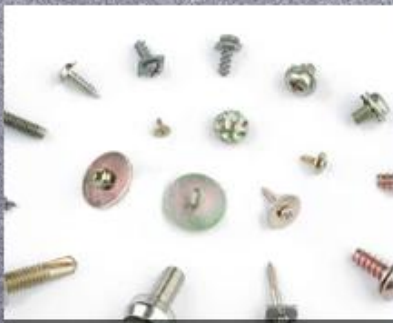
Screw With Washer