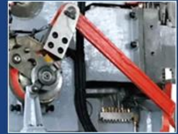
DIGITAL FEEDING OPERATED BY HAND WHEEL