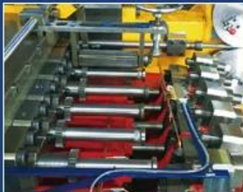
SLIDING SCREWED SLEEVE OF REAR K.O.