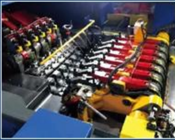
SWING PNEUMATIC GRIPPER