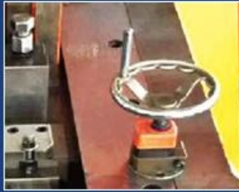
DIGITAL BAFFLING OPERATED BY HAND WHEEL