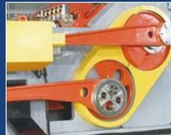
CUT OFF PART