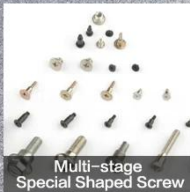
Multi-stage Special Shaped Screw