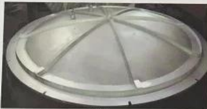
炉盖 The furnace cover