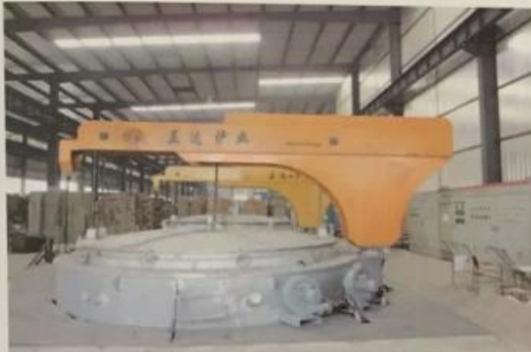
用于五金工具行业球化炉 Used for the hardware tool industry