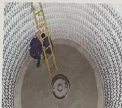
电加热炉 Electric heating furnace