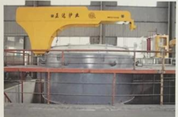
用于轴承行业球化炉 Used for the bearing industry