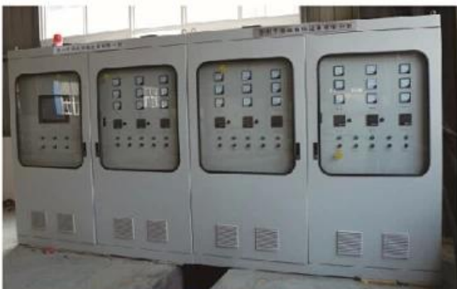
Electric Control Cabinet