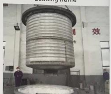
波纹桶 Corrugated bucket