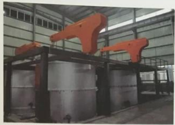
用于汽配行业球化炉 Used for the auto parts industry