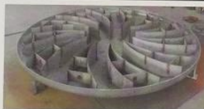
导流板 Air deflector