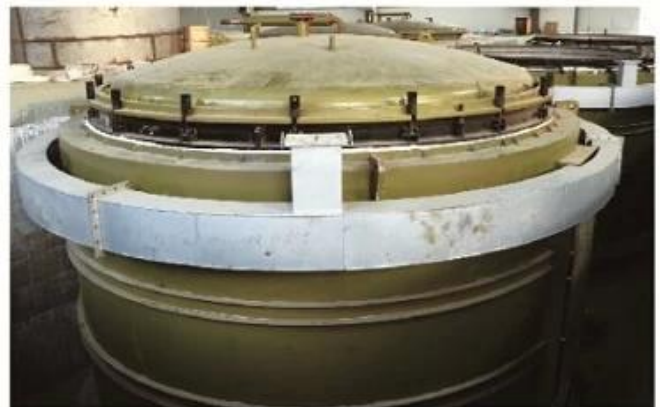
Well Type Electric Annealing Furnace (Main Furnace)