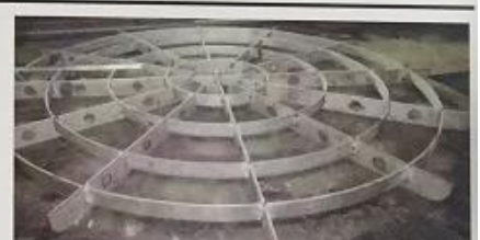
置料架 Loading frame