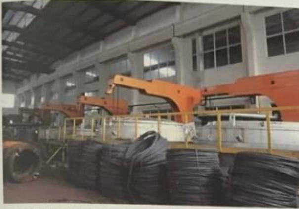
用于标准件行业球化炉 Used for fastener industry