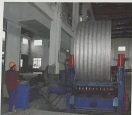
波纹桶成型 Corrugated molding