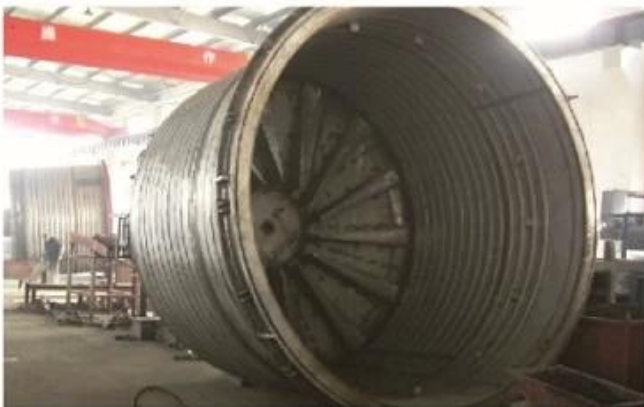
Liner of Well Type Electric Annealing Furnace