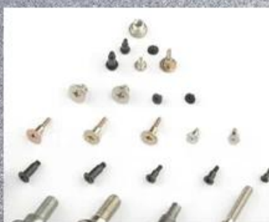
Multi-stage Special Shaped Screw