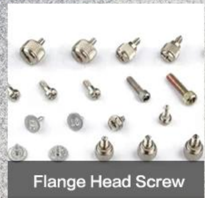
Flange Head Screw