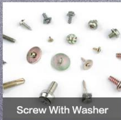
Screw With Washer