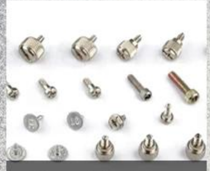
Flange Head Screw