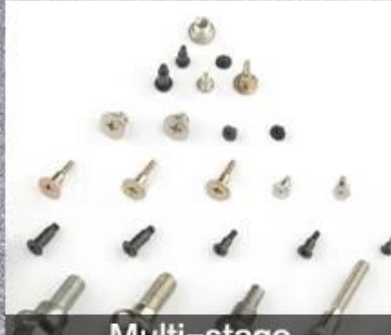
Multi-stage Special Shaped Screw