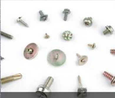
Screw With Washer