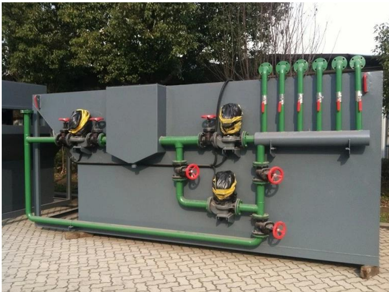
Máy sấy khô: