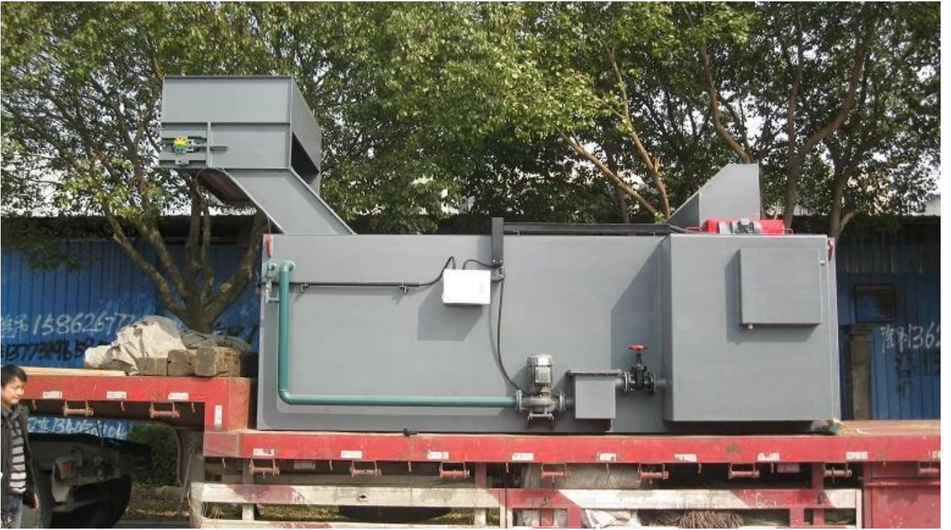
Dập tắt TANK dầu: