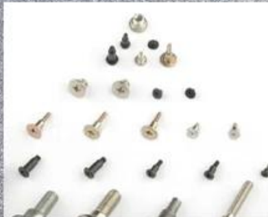
Multi-stage Special Shaped Screw