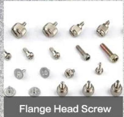
Flange Head Screw