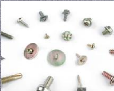
Screw With Washer