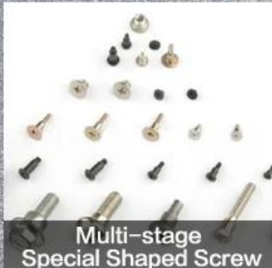
Multi-stage Special Shaped Screw