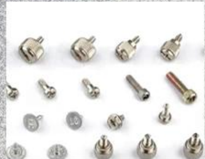
Flange Head Screw