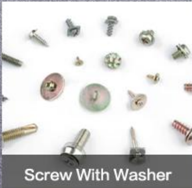
Screw With Washer