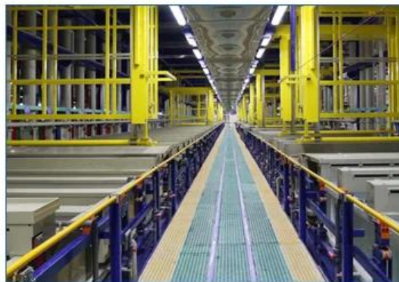
zinc electroplating line

Automatic plating production line is mainly applicable to all kinds of small parts and various non-standard items. The equipment is mainly composed of manipulator, tank body, drum, transmission mechanism, conveying device and so on, to meet the various products of different processes to the plating production.