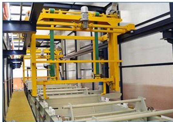
Zinc barrel plating line