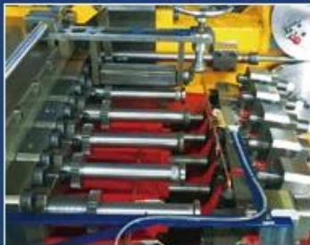
SLIDING SCREWED SLEEVE OF REAR K.O.