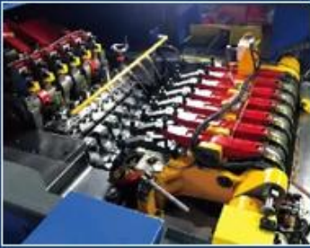
SWING PNEUMATIC GRIPPER