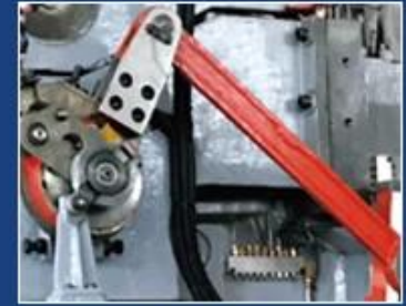
DIGITAL FEEDING OPERATED BY HAND WHEEL