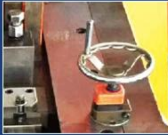
DIGITAL BAFFLING OPERATED BY HAND WHEEL