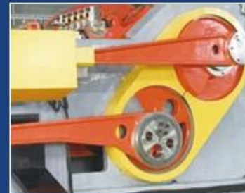
CUT OFF PART