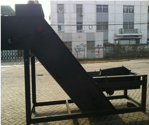
Zbiornik z barwnikami dwuwarstwowymi: