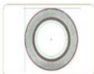
倒角/真圆度/内径/外径 Chamfer/Roundness/ Internal/External