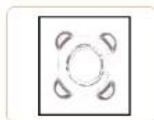
焊点面积 welding points area