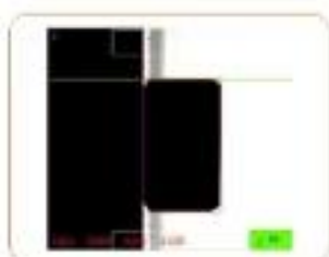
高度、外径 Height, diameter