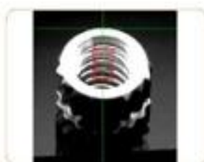
有无牙/牙距/牙数 WThread: Yes or No/Pitch Diameter/Thread Number