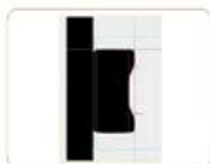
焊点高度 The solder joint height