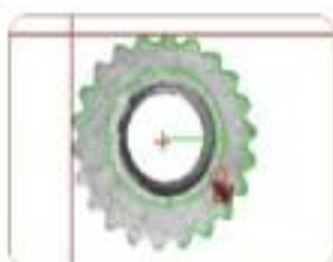
表面裂纹 Surface crack