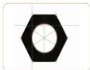
对角/对边 Cacross Corner/Across Flat