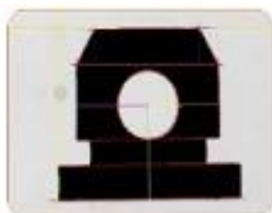
孔径/宽度/长度 Aperture / width / length