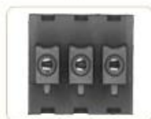
插槽宽度 Slot width