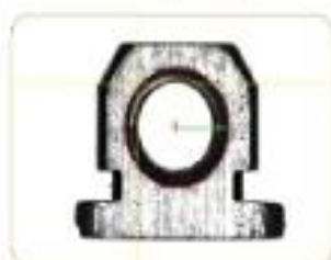
倒角直径 Chamfer diameter