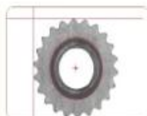
内倒角 Inner bevel