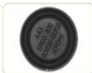
有无文字 Head Mark