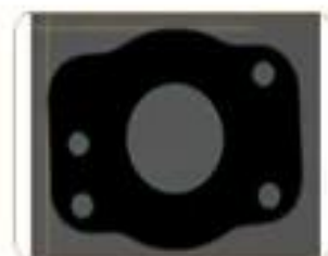
多个孔径 Multiple aperture