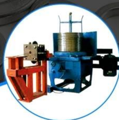
Belt wire drawing machine