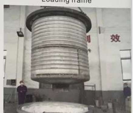
波纹桶 Corrugated bucket