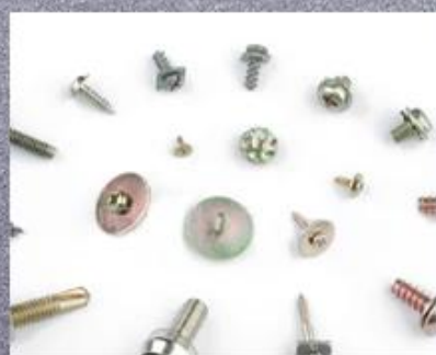
Screw With Washer