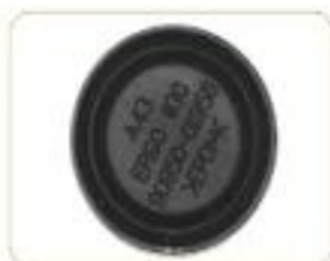
有无文字 Head Mark