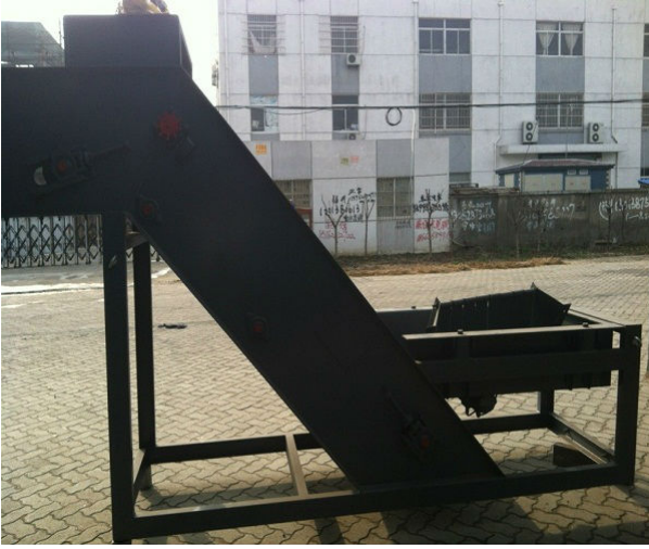
Çift katmanlı boya tankı: