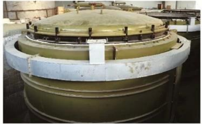
Well Type Electric Annealing Furnace (Main Furnace)