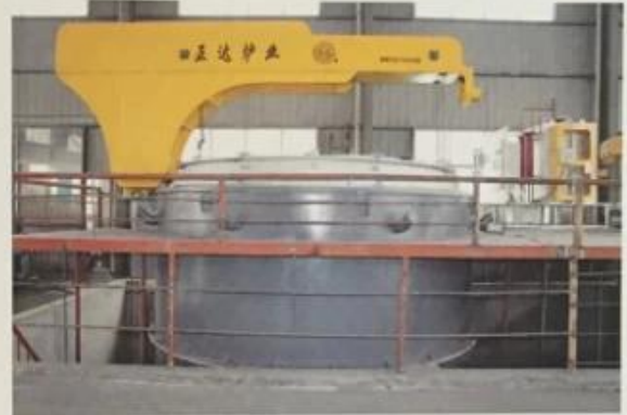
用于轴承行业球化炉 Used for the bearing industry