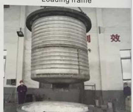
波纹桶 Corrugated bucket