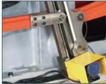
ELECTRICAL DIGITAL FEEDING