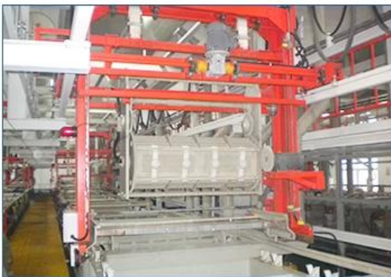
Nickel barrel plating line

Automatic plating production line is mainly applicable to all kinds of small parts and various non-standard items. The equipment is mainly composed of manipulator, tank body, drum, transmission mechanism, conveying device and so on, to meet the various products of different processes to the plating production.