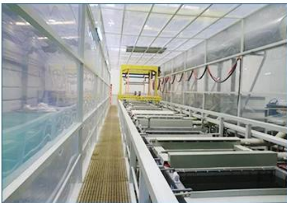
Phosphorization production line

Linear plating Automatic production line for mechanical parts, automobiles, motorcycle parts and other metal surface oxidation, nickel, chrome, galvanized and other process requirements, but also for engineering plastic surface of the metal plating, such as car decoration pieces, Mobile phone shell and signs and so on.