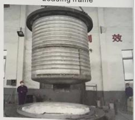
波纹桶 Corrugated bucket