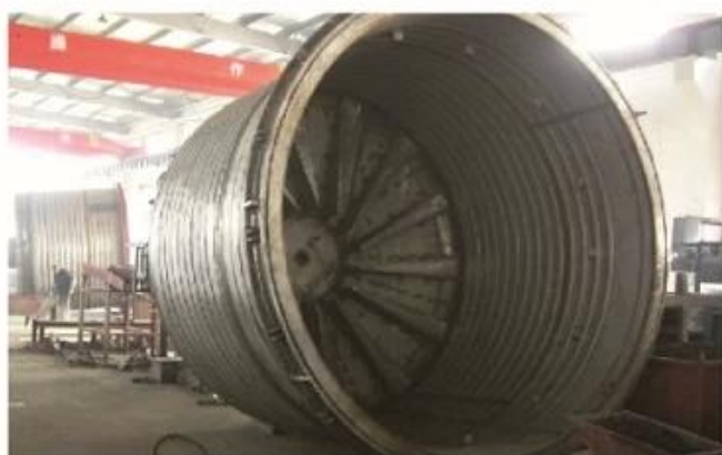
Liner of Well Type Electric Annealing Furnace