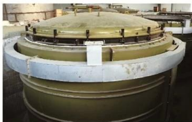
Well Type Electric Annealing Furnace (Main Furnace)